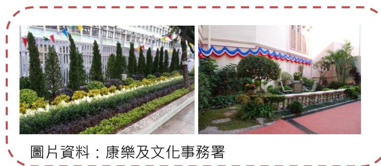
圖 2：綠化校園資助計劃

2.15 作為其中一個推廣綠化的措施，康文署自 2004 年開始推行「社區園圃計劃」。園圃計劃於特定的公園或休憩用地為參加者提供園藝課程，教授種植觀賞性植物、水果和蔬菜的基本技巧，讓參加者嘗試園圃種植，日後可以自己繼續種植(圖 3)。 (12) 截至 2016 年 9 月，此園圃計劃於 18 區成立了 23 個社區園圃，包括位於中西區的中山紀念公園社區園圃、深水埗的荔枝角公園社區園圃、沙田的車公廟路遊樂場社區園圃等。 (13)