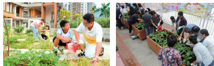
圖 4：公共屋邨內的社區園圃

的合適地點設置花床 / 花槽架，讓居民參與種植蔬果或農作物。房委會會為居民提供基本種植工具及技術支援。首個社區園圃計劃於 2008/09 年在沙田新翠邨開展。直至 2015/16 年，房委會已在 47 個公共屋邨推行這項計劃，並訂下目標在每個 2 公頃以上的新建屋計劃設立公眾種植區或社區園圃。此外，房委會亦與非政府機構合作推行社區園圃計劃，非政府機構會為參與人士提供導師及指引。