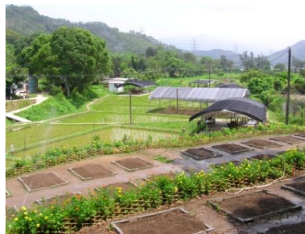
圖 8：綠田園有機農場