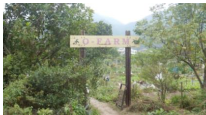
圖 7：老農田有機農場