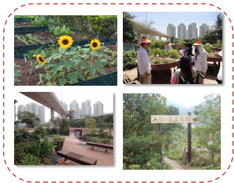
圖 1：香港的康樂及社區農耕